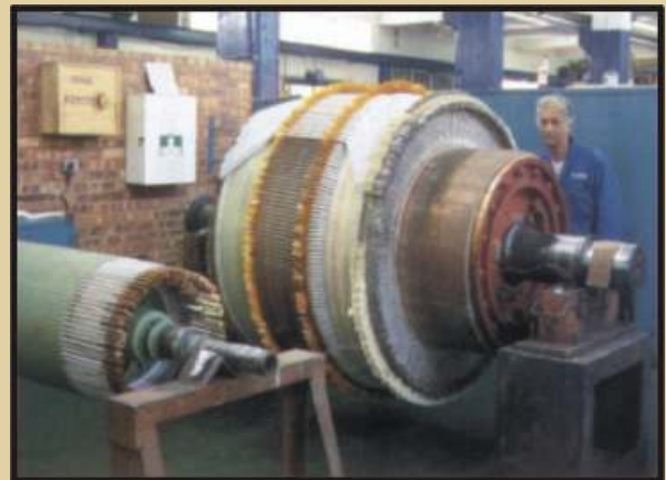
Motores, generadores y otros equipos repotenciados brindan alta eficiencia eléctrica sin invertir capital adicional.

Todo el ahorro en el consumo de energía contribuirá a un crecimiento económico sostenido y es esencial para lograr que nuestra industria sea competitiva en el mundo.