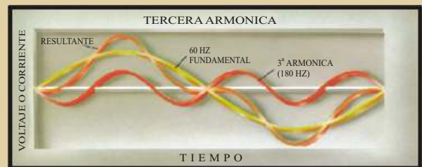
Con criterios de diseño adecuados se logra una alta eficiencia frente a las armónicas a través de todas las frecuencias.