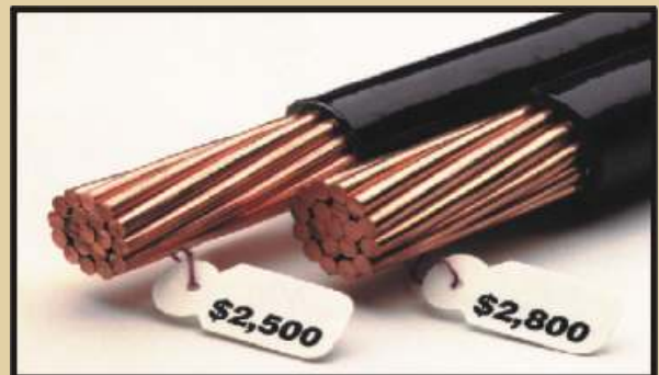
El del lado derecho es más rentable. Instalando conductores, de un calibre mayor al especificado, se consigue total confianza en la calidad de la energía que se recibe.

Eficiencia, Durabilidad, Confianza y Rentabilidad El cobre es la elección de los profesionales